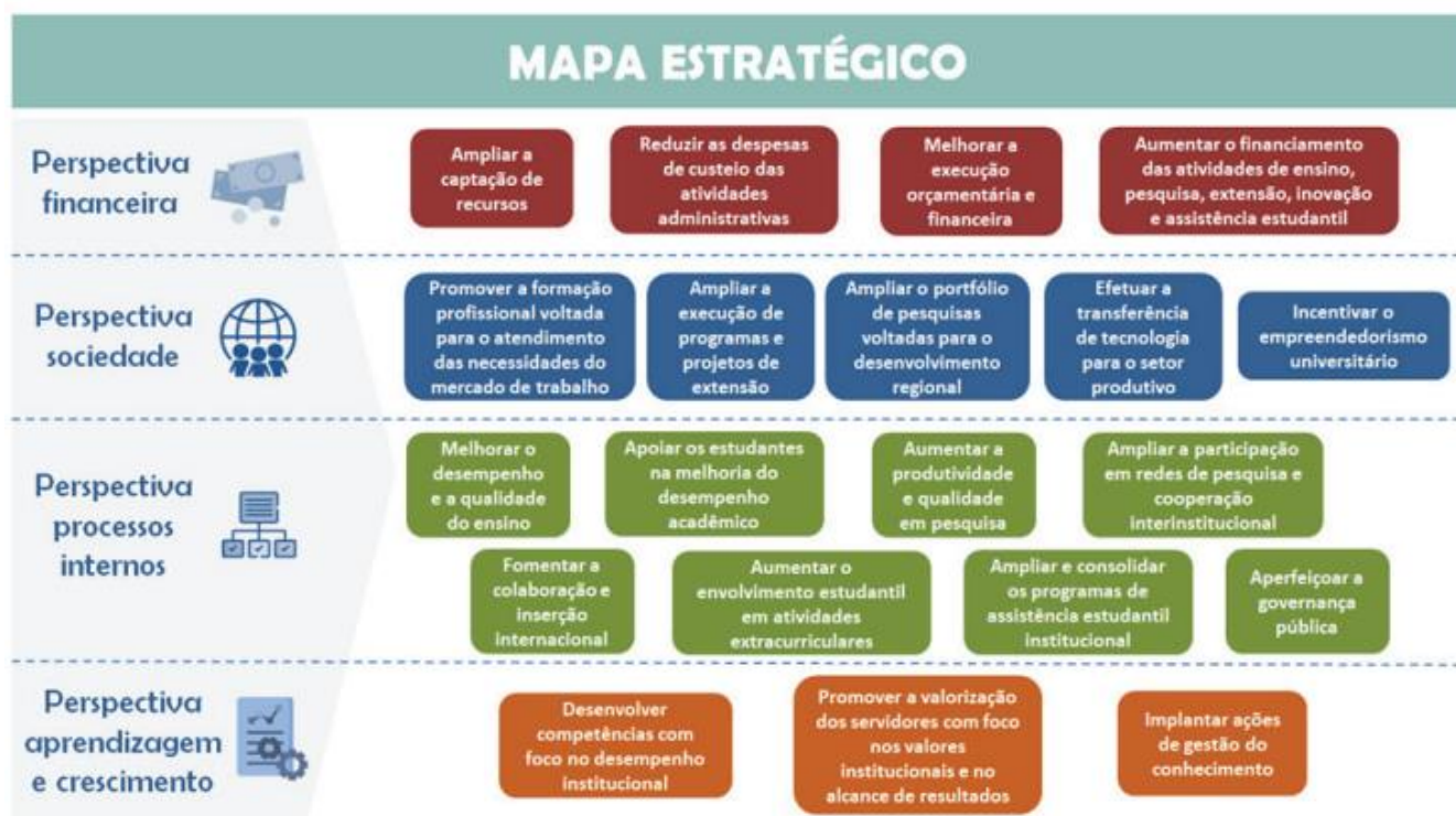
Figura 02 - Mapa estratégico